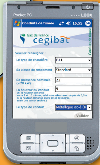
Pocket PC avec logiciel EVAPDC