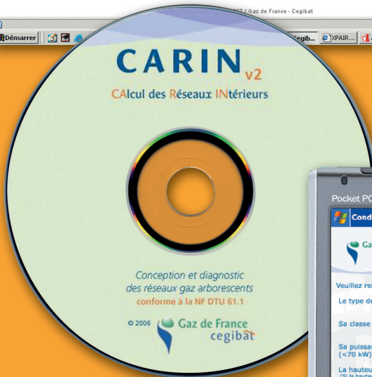
CDRom CARIN : CALcul des Réseaux INTérieurs